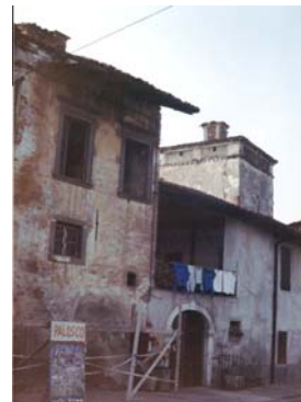
fronte su S.P. (storica)