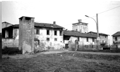
fronte su S.P. (storica)