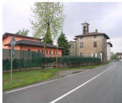
Cono di ripresa n. 2