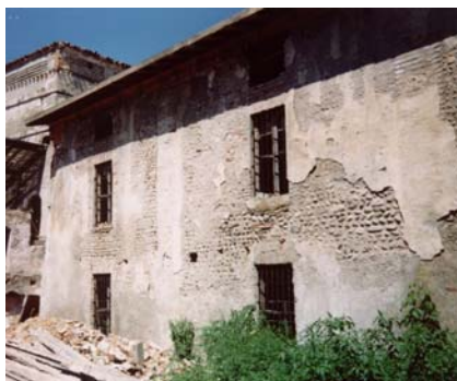
corpo a sud della torre