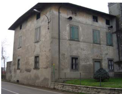
casa coadiutore (fine sec. XVIII)