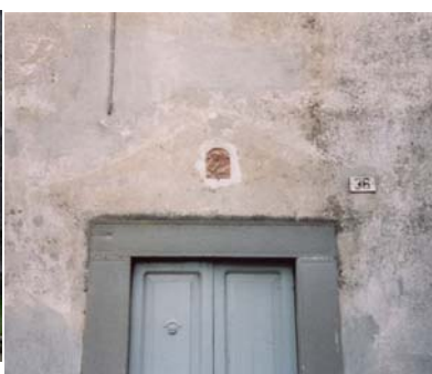
casa coadiutore decorazione