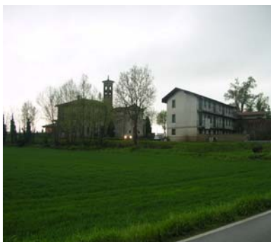
Cono di ripresa n. 1