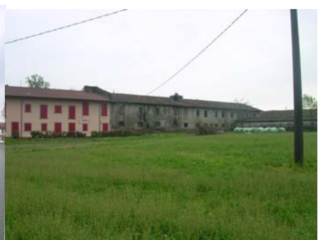
Cono di ripresa n.3