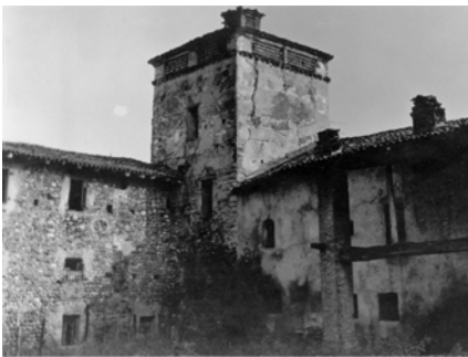
torre e adiacenze (storica)